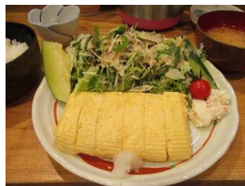
特にだし巻き定食が人気