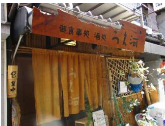
路地裏の隠れ家的小店