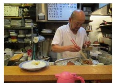
アットホームな雰囲気