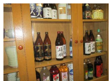
飲み物も 80 種類以上と、お酒好きにはたまりません