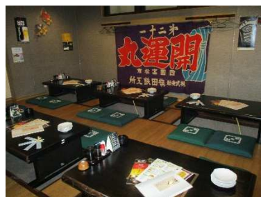
カウンターや座敷席など、様々なシーンに対応できます